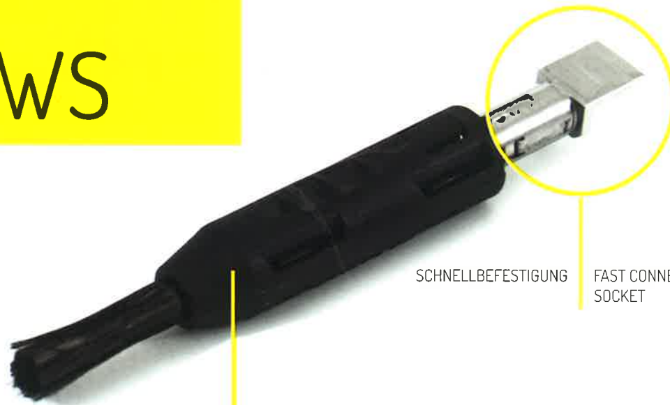
SCHNELLEBFESTIGUNG FAST CONNECTION SOCKET